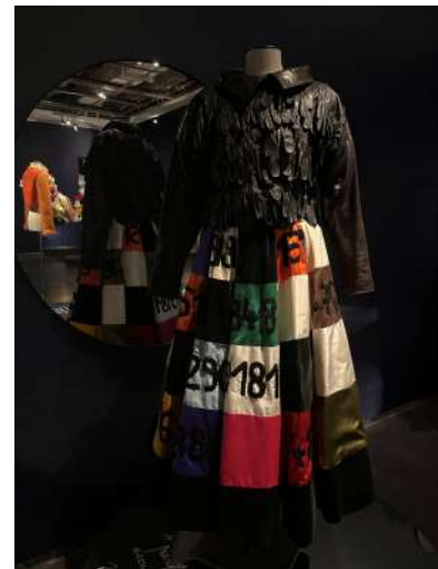
©Glove me tender (1988) et jupe "Parlons du soir" (1998), Jean-Charles de Castelbajac.

On voit un manteau avec des ours en peluche.