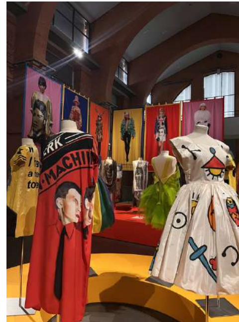
©Robe de scène "Calypso" (1987), et Trans-Europe Express (1980), Jean-Charles de Castelbajac.

L'artiste met des personnes connues sur ses vêtements.