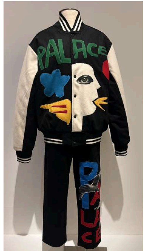
©Ensemble, Jean-Charles de Castelbajac, 2025.