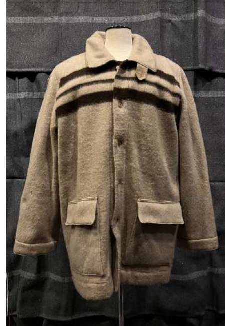
©Veste en couverture de pensionnaire, Jean-Charles de Castelbajac, 1976.

Cette couverture lui servait de protection .