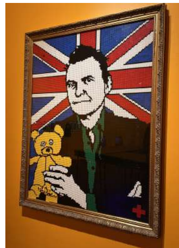
©Portrait, Jean-Charles de Castelbajac, 2007.

Il crée aussi des décors et des objets de design .