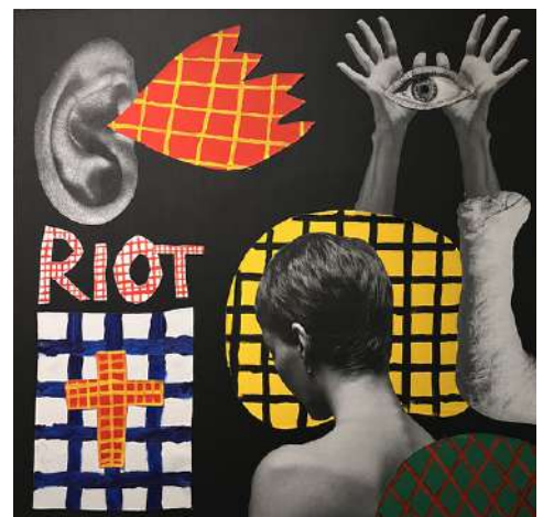
©Riot, Jean-Charles de Castelbajac, 2023.