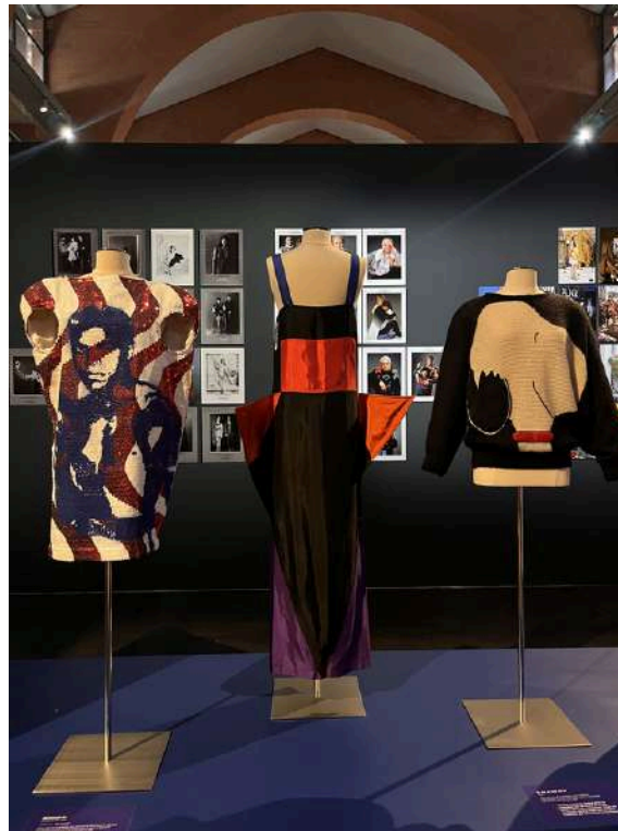
©robe Mohamed Ali (2008), et pull "To be or not to be" (1981) Jean-Charles de Castelbajac.