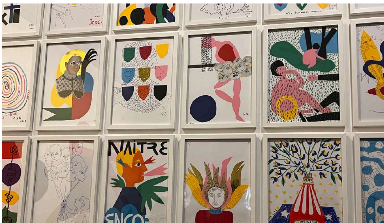
©Sélection de dessins sans titres, Jean-Charles de Castelbajac, 2023-25.

EXPOSITION DU 12 DÉCEMBRE 2025 AU 23 AOÛT 2026