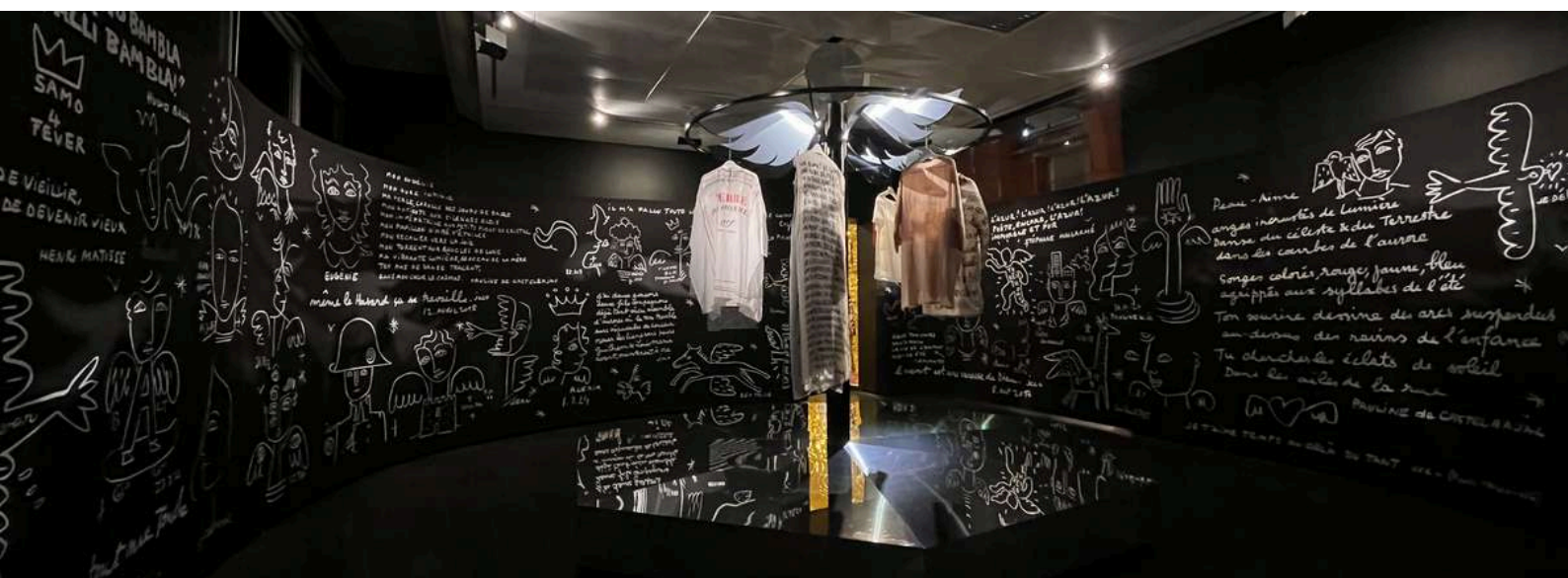
©Salle Mots émoi, Jean-charles de Castelbajac.

La couverture est la première page d'un livre.