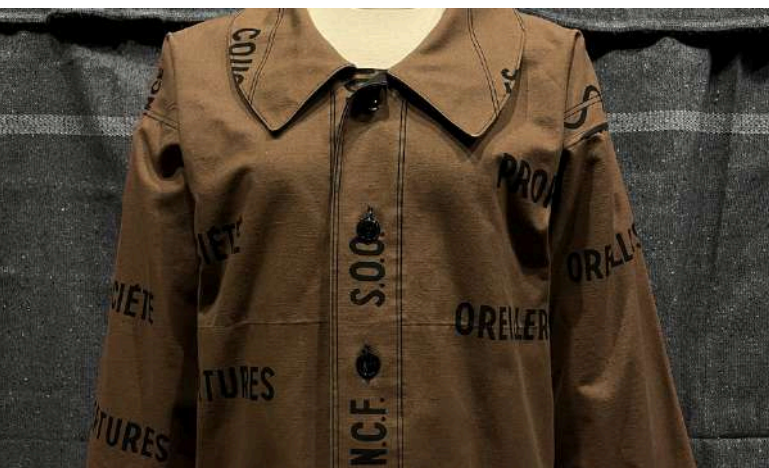
©Veste SNCF, Jean-Charles de Castelbajac, 1977.

Par exemple : des serpillères, des sacs, du carton.