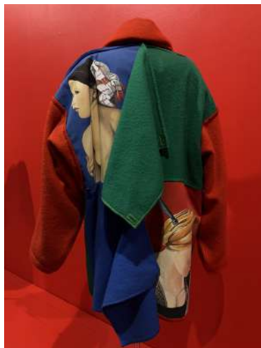
©Trésor caché, Jean-Charles de Castelbajac, 1992-93.