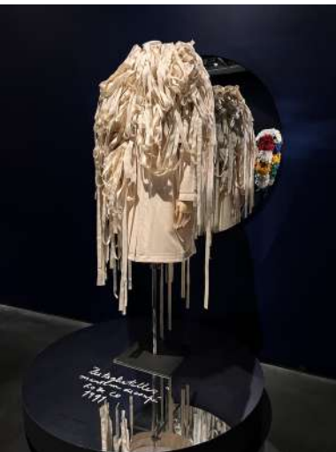
©Manteau "Tagliatelles", Jean-Charles de Castelbajac, 1991-92.

Une sculpture est une œuvre d'art que l'on peut voir de tous les côtés.