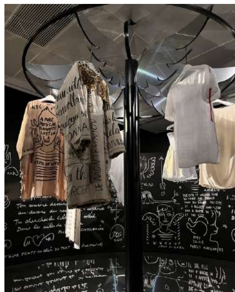
©Salle Mois émoi, Jean-charles de Castelbajac.

Le carrousel en photo est une installation.