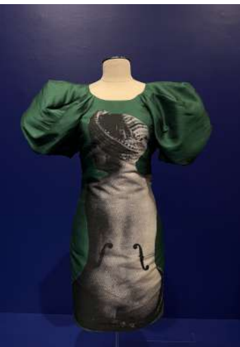
©Le violon d'Ingres, Jean-Charles de Castelbajac, 2011-12.

Il s'inspire des tableaux d'autres artistes pour faire ses vêtements.