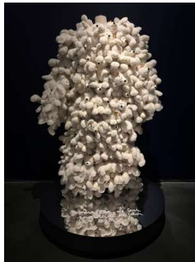
©Manteau nounours, Jean-Charles de Castelbajac, 2024.