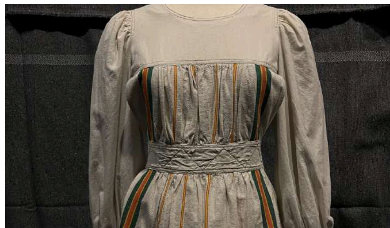
©Robe-tablier, Jean-Charles de Castelbajac, 1977.

Il transforme ces objets pour créer des vêtements.