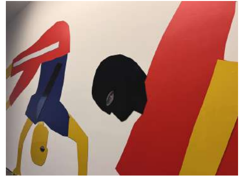
©Breakdance Sons, Jean-Charles de Castelbajac, 2025.

C'est-à-dire qu'il essaye des choses nouvelles.