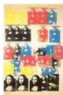
Analyse comparative avec le traitement de Mona Lisa, réalisée en 1963

Les portraits d'Andy Warhol, bien que n'utilisant pas l'outil informatique, sont basés sur la répétition et les variations partant d'une même image. Ils peuvent très bien constituer un déclencheur pour le professeur, en lui permettant d'élaborer des situations dans lequel l'outil numérique est requis....: Pastiches, parodies d'un visage célèbre, ou de son propre visage : " je suis dans tous mes états ".